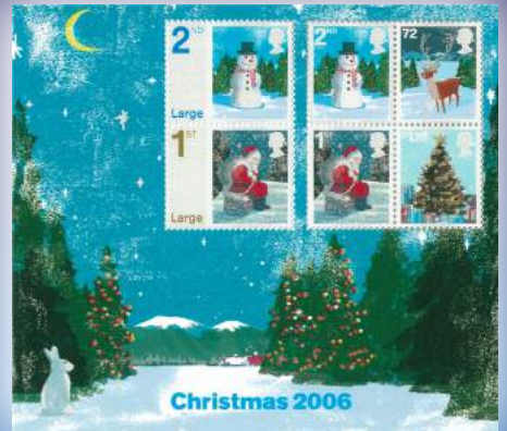
イギリスのクリスマス切手