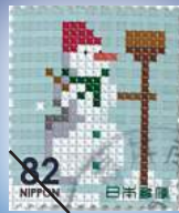
冬のグリーティング